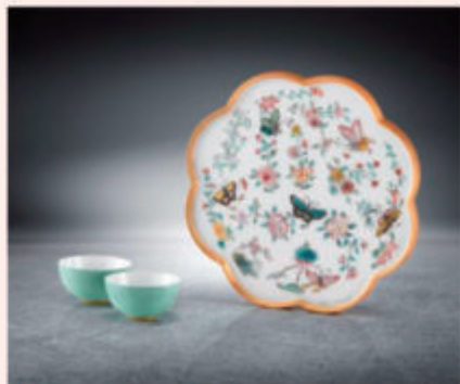
林翠華《花間彩蝶飛》