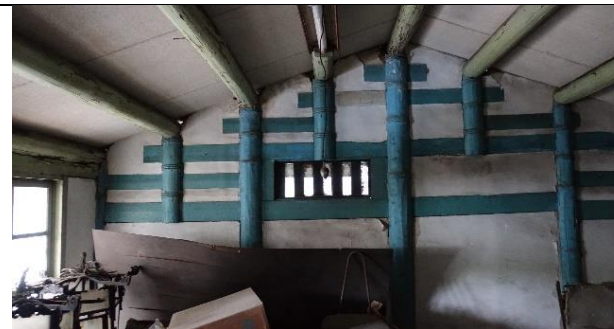
圖三: 現況內部(109 年)