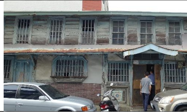
圖一: 現況外觀(109 年)