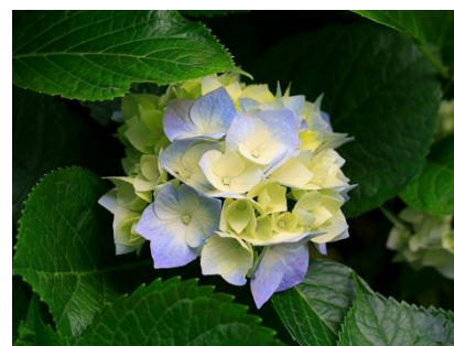
圖 1 繡球花

(二) 需要圖片說明且標示圖號(圖 1, 2…)，圖片說明為微軟正黑體；10 字級，文字置中