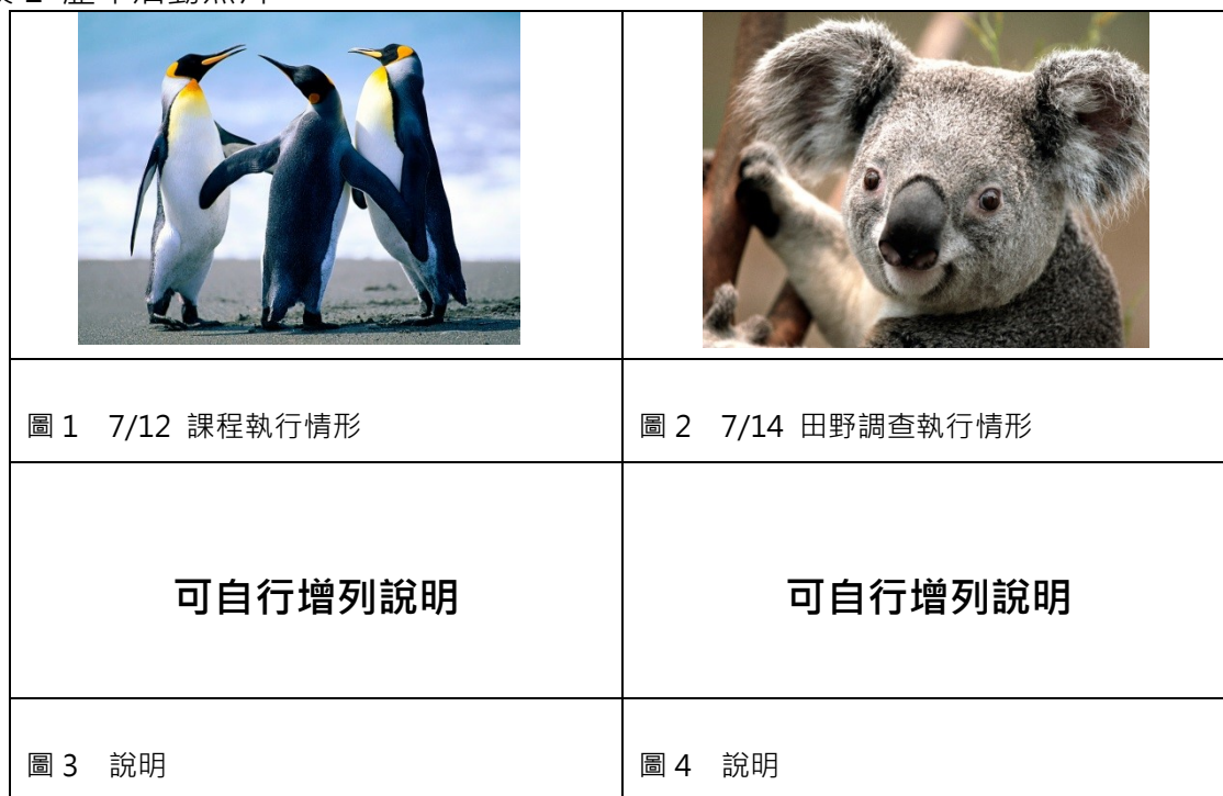
表 1 歷年活動照片