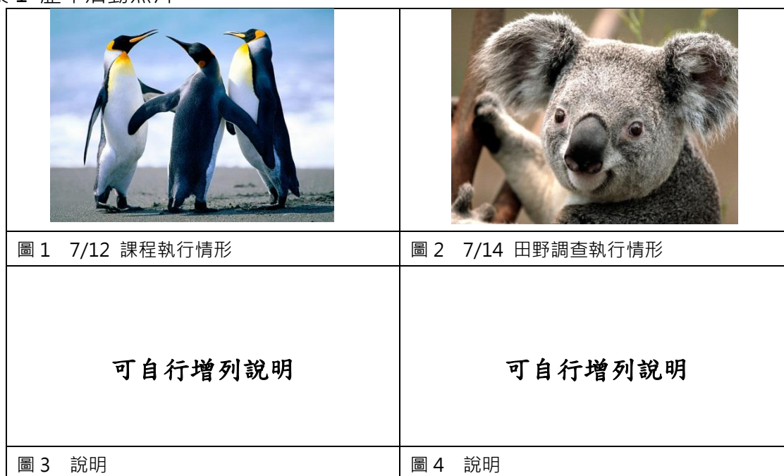
表 1 歷年活動照片

本中心曾申請嘉義市政府文化局社區營造二期與村落文化發展計畫，與學校合作辦理小記者培訓活動與閱讀體驗活動，各辦理了 3 場次，總計 6 場次。小記者培訓活動邀請了現役記者進行經驗分享及基礎指導，讓學生除了認識記者職業，也透過訪問及訪查的過程中，深入瞭解嘉義文化歷史。