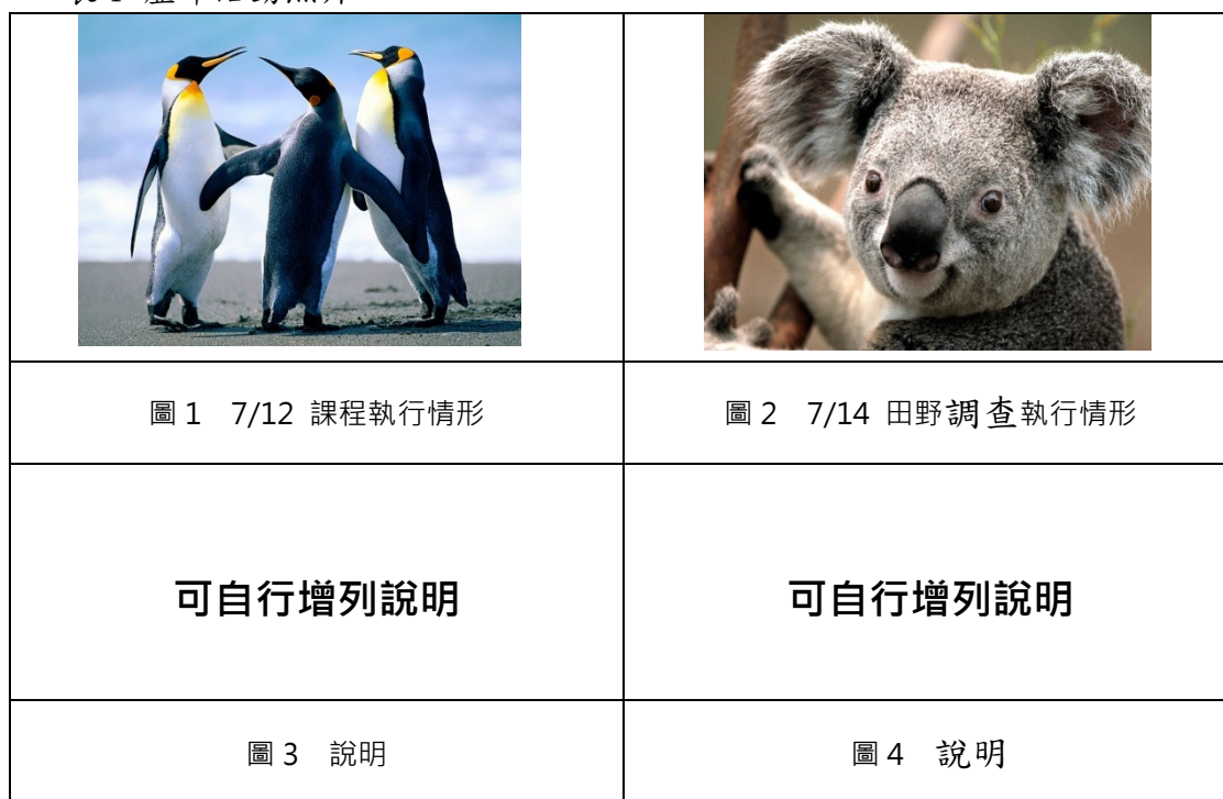
表 1 歷年活動照片