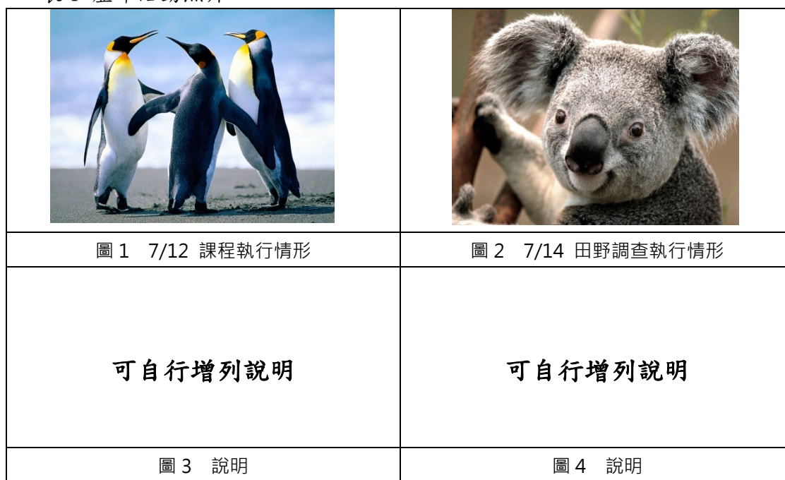
表 1 歷年活動照片

本中心曾申請嘉義市政府文化局社區營造二期與村落文化發展計畫，與學校合作辦理小記者培訓活動與閱讀體驗活動，各辦理了 3 場次，總計 6 場次。小記者培訓活動邀請了現役記者進行經驗分享及基礎指導，讓學生除了認識記者職業，也透過訪問及訪查的過程中，深入瞭解嘉義文化歷史。